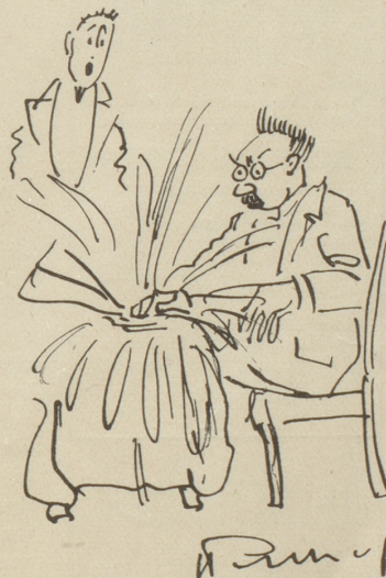
— — nochemol!