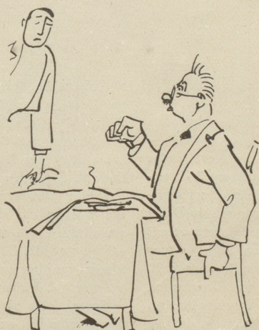
zum Dunnerwätter — —