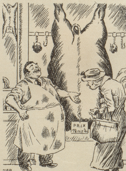
.... schön .... setzen wir die Preise herunter!