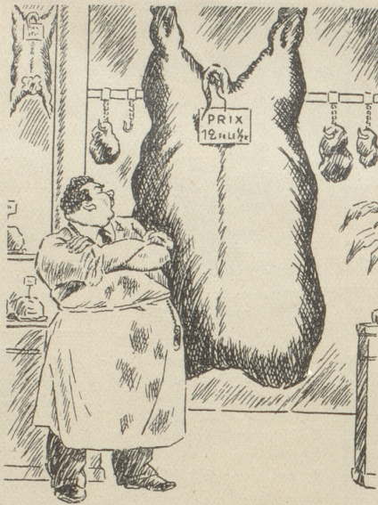
Die Preise sollen wir heruntersetzen ...