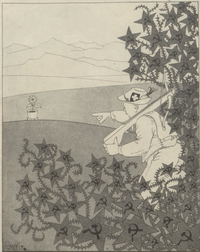
Der Eidgenosse: „Kous mit dieser Pflanze! Jä duide kein „inFrau“ in meinem Garten!“