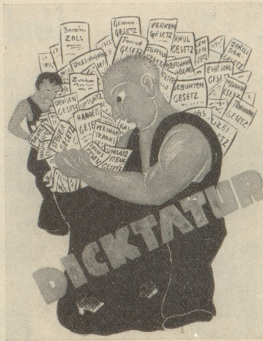
Dä Papierverbruuch wird na dem ganze Land zum Säage.

«Es hat geheissen Erstens Ka Jjte Zweitens Ka Jjte Drittens Ka Jjte Nor deutsche Loit. Da bin ich wieder ausgestiegen.» F. W. B.