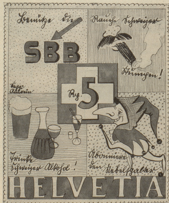
Aus der Serie: Neue Schweizer Briefmarken