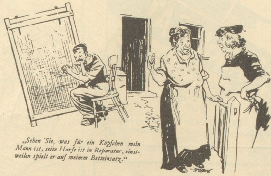
„Sehen Sie, was für ein Köpfchen mein Mann ist, seine Harfe ist in Reparatur, einstweilen spielt er auf meinem Bettensatz.“

«Die roten Lippen, die küssten so wild, so stürmisch, so sinneverwirrend;