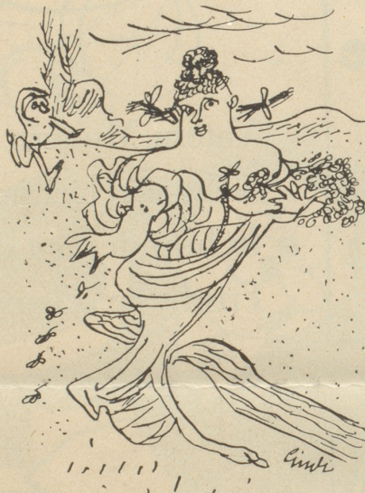
Flora wie sie Böcklin sah.

laut zu rufen. Keine Antwort. So zündete ich denn meine Pfeife an und setzte mich auf einen bemoosten Felsblock, der kommenden Dinge gewärtig. Nach einer halben Stunde rauschte es in den Büschen auf. Billy sprang in weiten Sätzen auf eine kleine Lichtung zu. Hinter ihm her schritt der Junge auf unhörbaren Sohlen, ein richtiger Pfadfinder. Ein breites Lachen lag auf seinem Antlitz. Bill hielt an, wischte sich den Schweiß von der Stirne, nachdem er den Hut abgenommen hatte. Der „Schwarze Spion“ beobachtete ihn lauend.