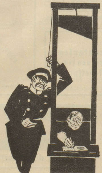
Wie sich Pilsudski seinen Parla- mentarismus vorstellt! Notenkraker

Mit einem fast unvergleichlich harmonischen, förmlich leidenschaftlich visionären Paukenton schliesst die Schilderung, die Romain Rolland in seinem Vorwort allzu höflich eine ehrfürchtige und ergreifende, der Autor aber einsichtsvoll eine unzureichende nennt und die wohl nur entstehen konnte, weil des bekannten russischen Kulturhistorikers Rechte nicht wusste, was die wildgewordene Füllfeder tat. (Jos. Ehling.)