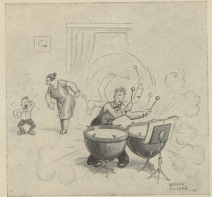
„Kurtchen! Willst du wohl ruhig sein, wenn Papa übt!“ Judge