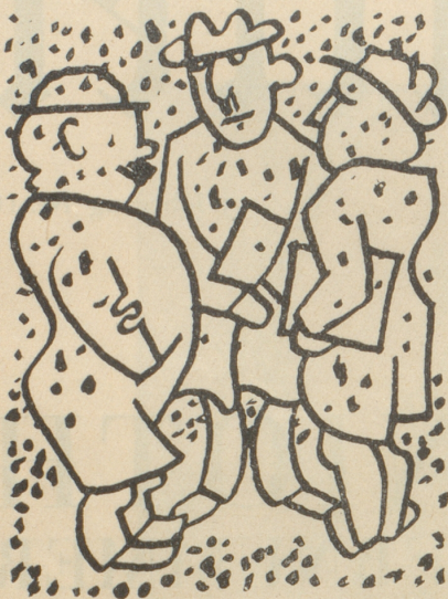
Sie reden und stehen —