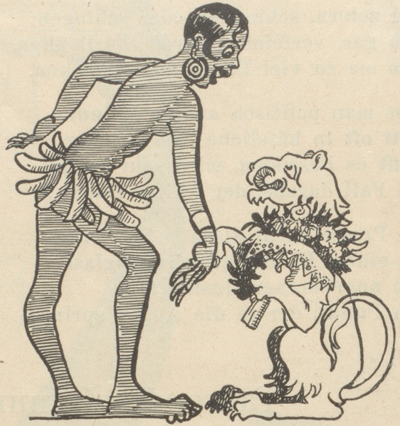
Die Zürcher Sensation.

Der Zürileu schlägt mordsgalant den Wedel, Vor Josephin, dem Negermädel, Der Stammverwandten von zu Haus Gebührt ein Knix, ein Blumenstrauß, Er grüßt sie mit dem allerliebsten Psalm Und knurrt: Ich küsse ihre Hand, Madame.