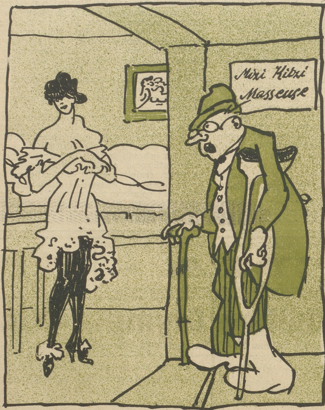
Sie: Pardon! Sie haben sich wohl geirrt!