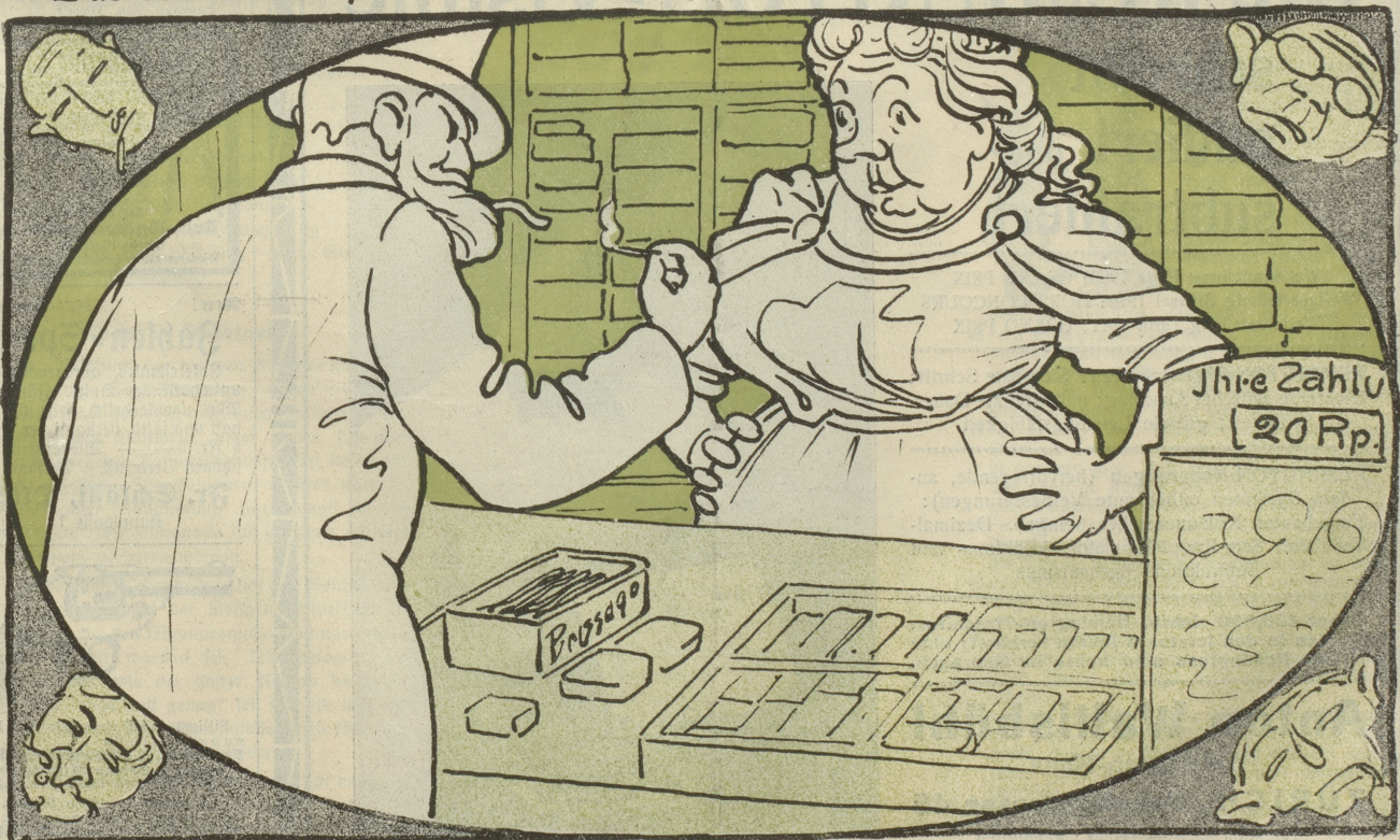
„Ja, teurer wird der Tabak allerdings; dafür wird er aber auch schlechter.“