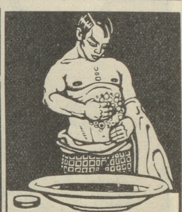
Tägliche Brustwaschungen mit Grolichs Heublumenseife fördern die Lungentätigkeit.