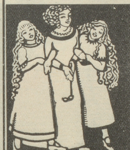
Frauen und Mädchen sind von der wunderbaren Wirkung von Grolichs Heublumenseife überzeugt u. kaufen nur diese.

Rest. Froburg ZÜRICH 6 Telephon 926 Besitzer: Alb. Neumaier, Sohn (Nachfolger des G. Neumaier sel.) empfiehlt sich bestens. Nur erstklassige, prima Hospiz-Hunde. Erste und Ehrenpreise im In- und Ausland Abgabe von Jungen jeden Alters, kurz- und langhaarig. 1233