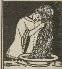
Kopfwuschungen mit Grolichs Heublumenseife entfernen Schuppen, stärken den Haarboden und machen das Haar voll und wellig.

Mütter! Waschet Eure kleinen Lieblinge mit Grolichs-Heublumenseife und auch Ihr werdet Euch an deren Gesundheit und rosigen Aussehen erfreuen. Grolichs-Heublumenseife ist in allen Apotheken, Drogerien, bei den Coiffeurs, sowie in allen Kontingengeschäften zu haben. Man hüte sich vor Nachahmungen und nehme nur solche Seifenstücke, die aus Brünn stammen und Grolichs-Bild und Namen trägt. Mit einer gefälschten Seifenstückchen würdest Du, lieber Vater, diese Erfolge nicht erzielen. Nur Grolichs-Heublumenseife aus Brünn ist eine Gesundheits- und Schönheitsseife sans rival.