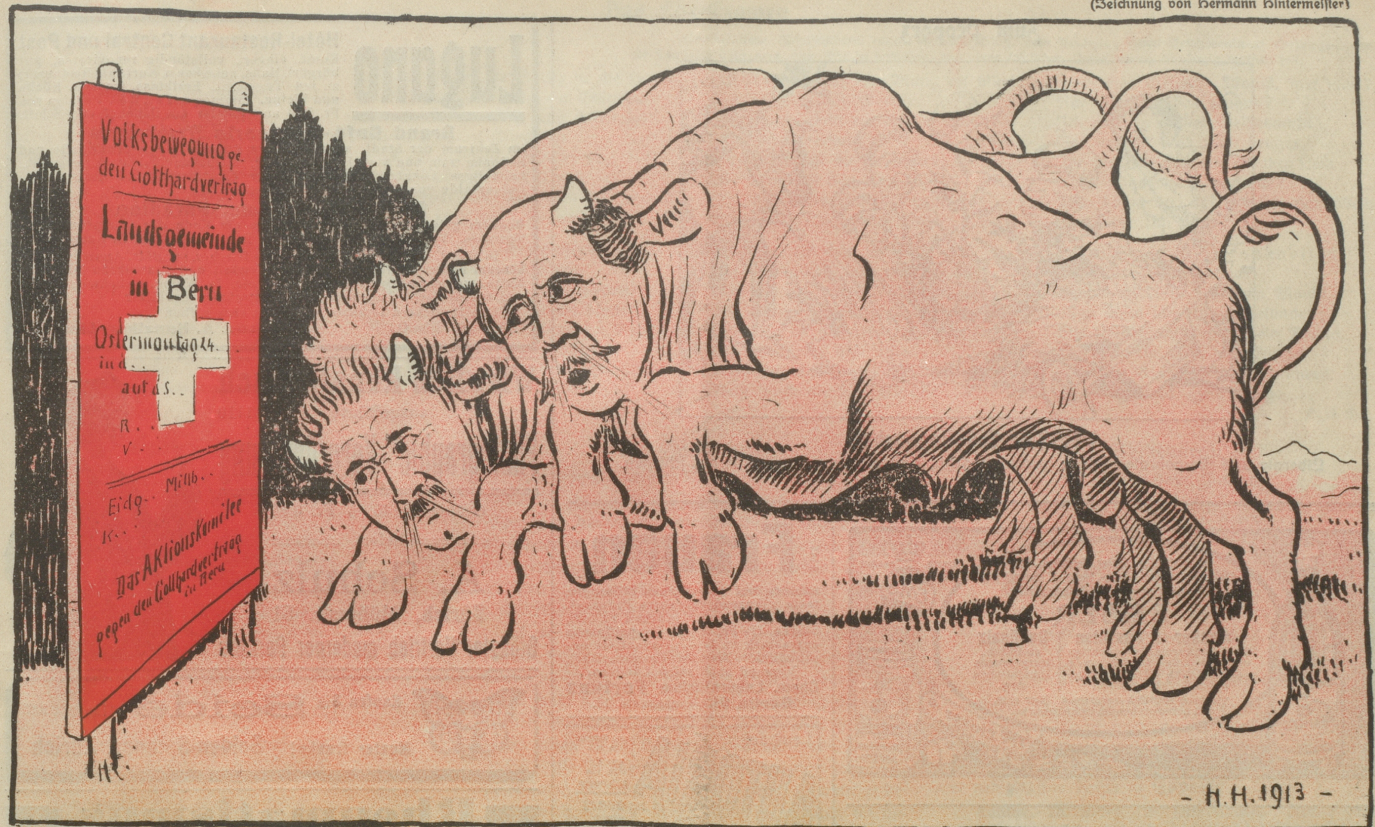
Die Direktion der Bundesbahnen hat verboten, daß in den Bahnhöfen das Plakat des Aktionskomitees gegen den Gotthardvertrag angehängt werde