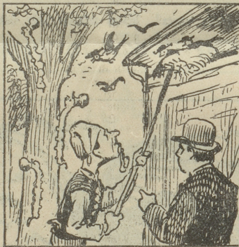
„Ja, ja, de häscht rächt, Mädel, fahr nu ab mit dem Ungezifer, fuß fräße's d'r die ganz Ernst!“