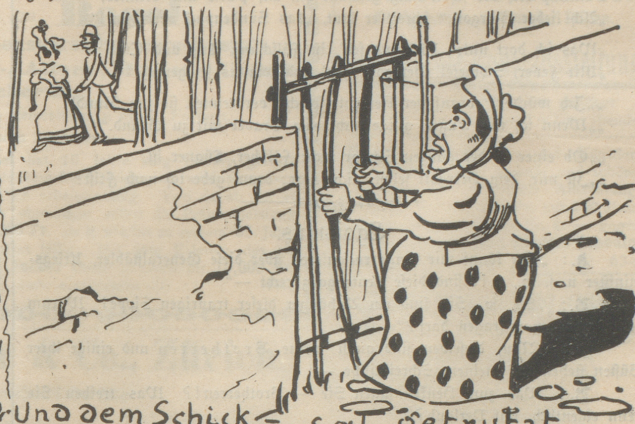
2-Und dem Schicksal getrübt