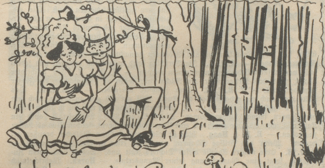
3-Dann im Himmel gesessen