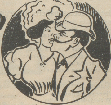
4-Und den Schnabel geputzt.