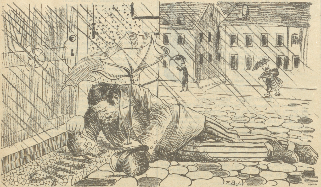
„Mir ist Alles egal — Alles Wurst — Donnerwetter — aber ein Schlüsselloch braucht der Mensch doch! — — —“