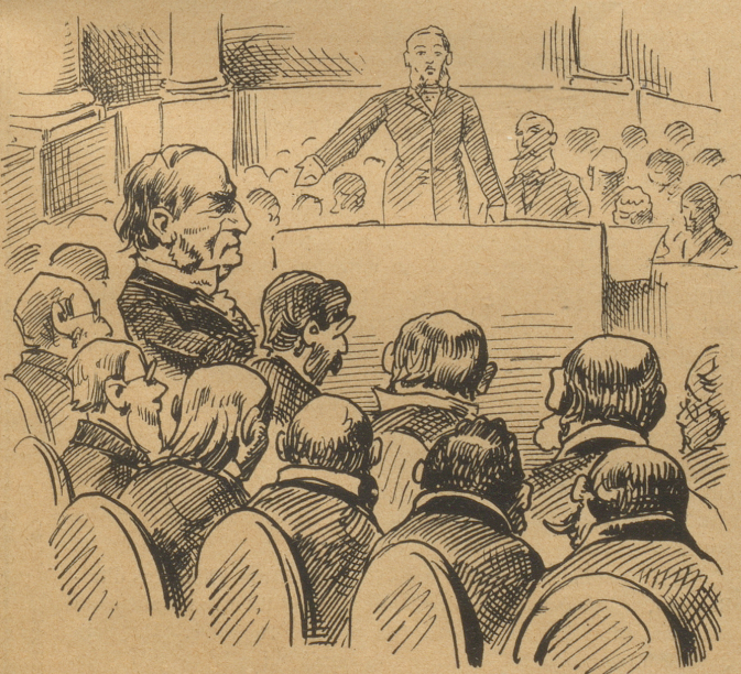
Jetzt stimmt Keiner dagegen;

sieht sich aus der Nähe besehen zum Aerger Gladstone's jetzt und später ganz gleich an, nämlich: