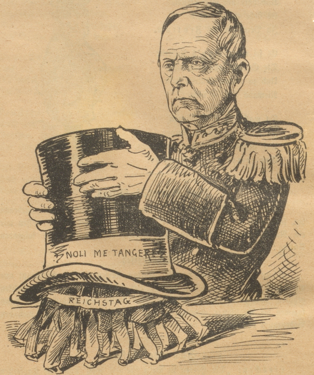
den Deutschen Reichstag sofort darunter zu bringen, hat doch der greise Moltke wieder bei der Hand gehabt.