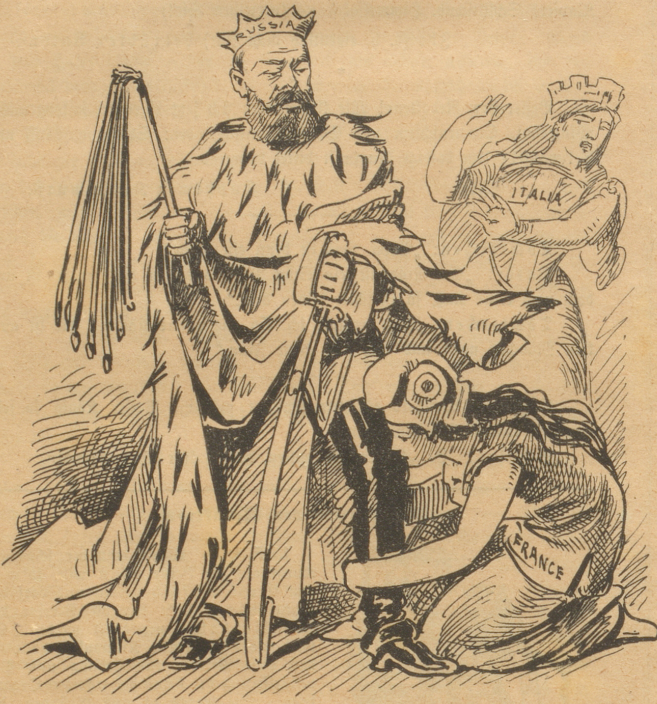
Die Freiheit kauft der brutalen Gewalt, von welcher selbst Monarchien Nichts wissen wollen, die Stiefel. Dooh!