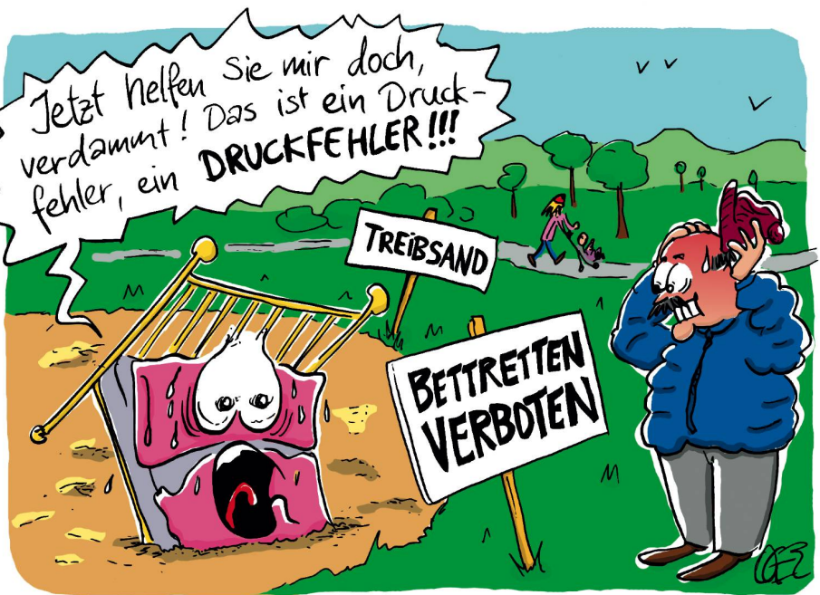
OGER (ANDREAS ACKERMANN)

H ugo kann sich heute nach so vielen Jahren nicht mehr erinnern, ob sie damals das Bettmümpfeli vor oder nach dem Zähneputzen bekommen hatten. Wahrscheinlich hatte man sich für den goldenen Mittelweg entschieden und einfach die Zähne vor und nach dem Mümpfeli nicht geputzt. Überhaupt machte man lange nicht ein solches Theater mit dem ins Bett gehen. Hugos Grossmutter ging sogar mit den Hühnern ins Bett, Grossvater nach der Polizeistunde. Hugos Eltern hingegen bekamen, damit sie sogleich einschliefen, als Bettmümpfeli den Nuggi in den Mund, den ihre Mutti vorher in Zwetschenwasser getaucht hatte. Ihr Gatte wollte seine Ruhe haben. Er trank das Zwetschenwasser aus der Flasche und ist mit 50 an Schlafapnoe gestorben und zwar – wie der Name der Krankheit stark vermuten lässt – im Bett, wie er sich das immer gewünscht hatte. Seine Mutter, also Hugos Grossmutter, hatte noch ein Bett aus Laub. Immer im Herbst haben sie trockenes Laub gesammelt und in einen Sack gesteckt. Darauf schliefen sie. Auch der Grossvater hatte ein solches Laubbett. Eigentlich müssten sich heutzutage die ökologisch Angehauchten jeden Herbst in den Wald aufmachen zum Blätter sammeln. Mit dem Laubbläser wäre so ein Laubbett schnell zusammengeblasen. Es gibt auch Bläser mit Abgasnorm. Problematisch war es damals, wenn einer ins Laub-