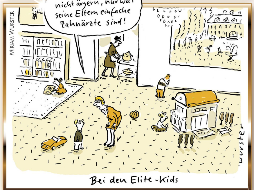
Bei den Elite-Kids