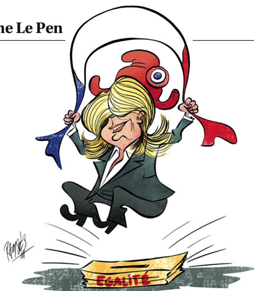
RAMON MORALES IZQUIERDO