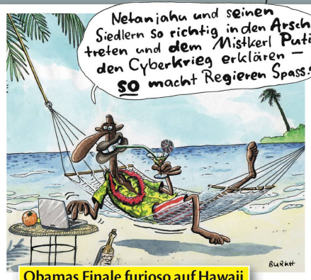
Obamas Finale furioso auf Hawaii