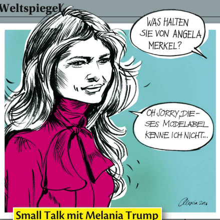
Small Talk mit Melania Trump