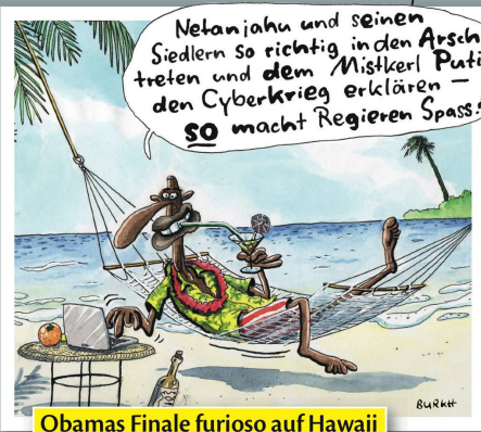
Obamas Finale furioso auf Hawaii