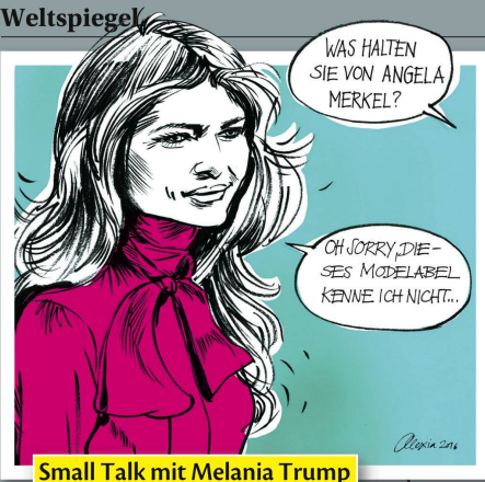
Small Talk mit Melania Trump