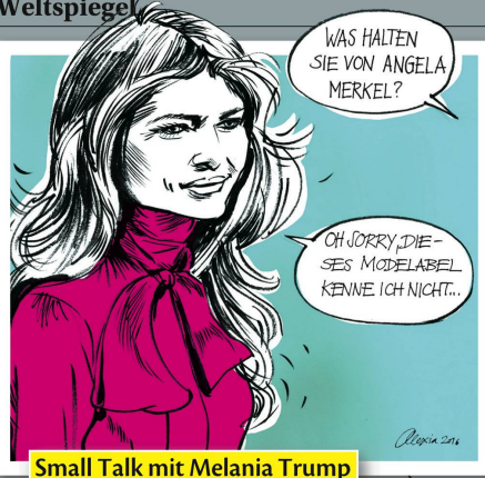
Small Talk mit Melania Trump