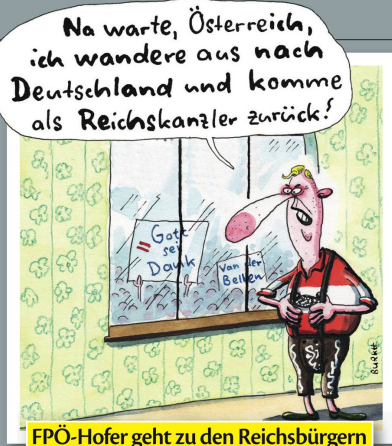
FPÖ-Hofer geht zu den Reichsbürgern