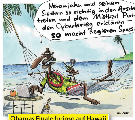
Obamas Finale furioso auf Hawaii