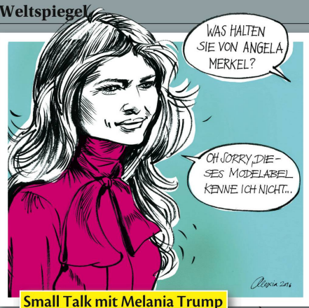
Small Talk mit Melania Trump