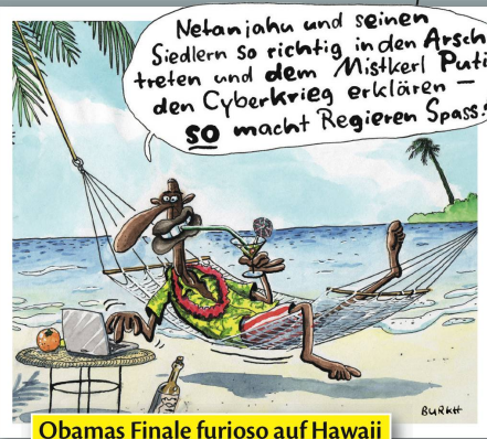
Obamas Finale furioso auf Hawaii