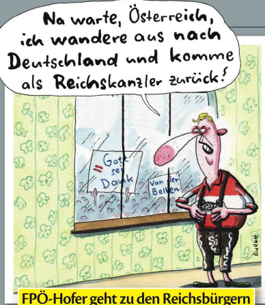
FPÖ-Hofer geht zu den Reichsbürgern