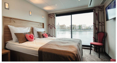
2-Bettkabine Mittel- und Oberdeck mit franz. Balkon

Weitere Reisen mit MS Edelweiss***** Basel-Rotterdam-Amsterdam-Basel 9 Tage ab Fr. 690.- (Rabatt Fr. 700.- abgezogen, 08.03., Hauptdeck) Passau-Regensburg-Miltenberg-Basel v.v. 9 Tage ab Fr. 790.- (Rabatt Fr. 500.- abgezogen, 30.10., Hauptdeck hinten) Basel-Koblenz-Baden-Baden-Basel 6 Tage ab Fr. 290.- (Rabatt Fr. 200.- abgezogen, Hauptdeck hinten) Passau-Eisernes Tor-Budapest-Passau 13 Tage ab Fr. 1690.- (Rabatt Fr. 400.- abgezogen, Hauptdeck hinten) Passau-Bukarest-Donaudelta-Budapest-Passau 17 Tage ab Fr. 2090.- (Rabatt Fr. 700.- abgezogen, 14.10., Hauptdeck hinten)