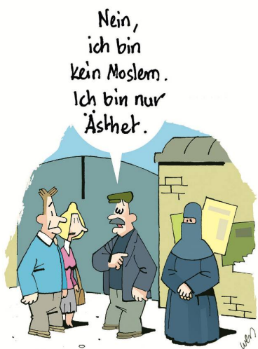
CARTOONS: KARSTEN WEYERSHAUSEN