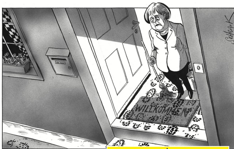
Peter Schrank | Basler Zeitung