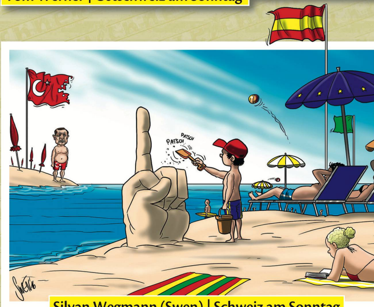
Silvan Wegmann (Swen) | Schweiz am Sonntag