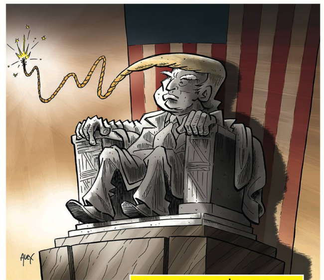
Alex Ballaman | La Liberté