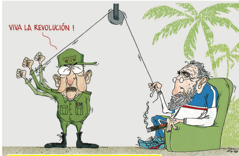
Tom Werner | Ostschweiz am Sonntag