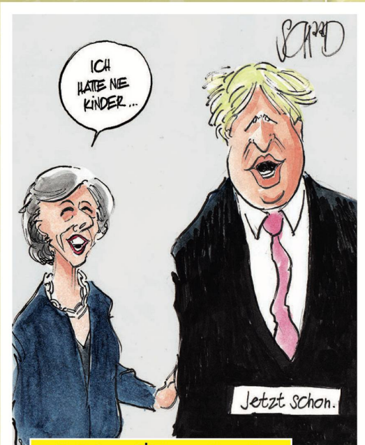
Felix Schaad | Tages-Anzeiger