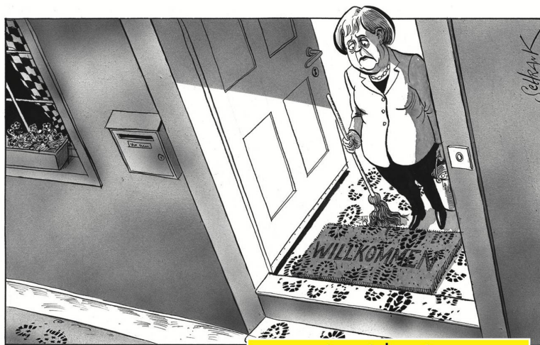
Peter Schrank | Basler Zeitung