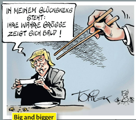
Big and bigger