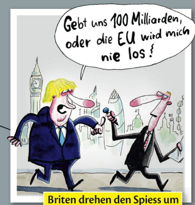
Briten drehen den Spieß um