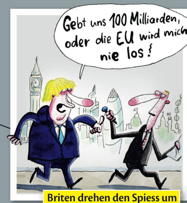
Briten drehen den Spieß um