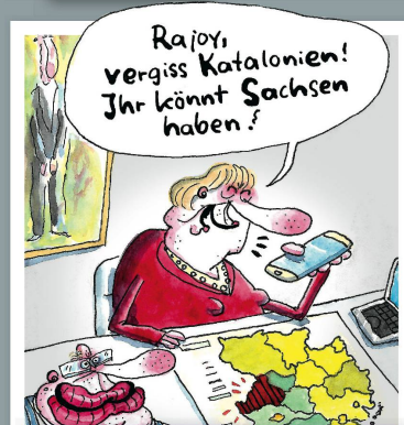
Kanzleramt nach dem Wahldebakel