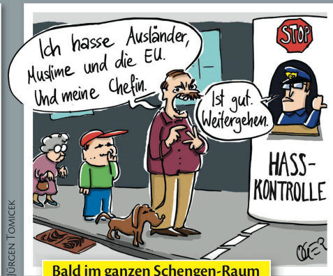
Bald im ganzen Schengen-Raum