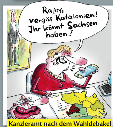
Kanzleramt nach dem Wahldebakel