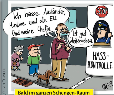
Bald im ganzen Schengen-Raum