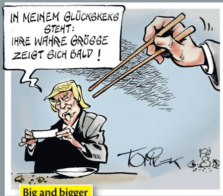
Big and bigger