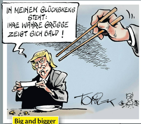
Big and bigger