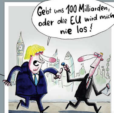
Briten drehen den Spieß um