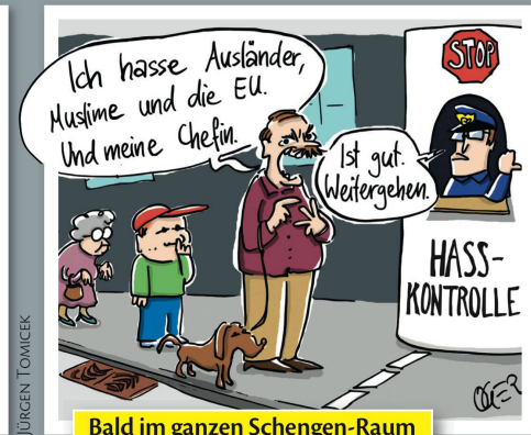
Bald im ganzen Schengen-Raum