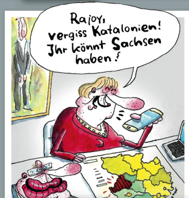
Kanzleramt nach dem Wahldebakel