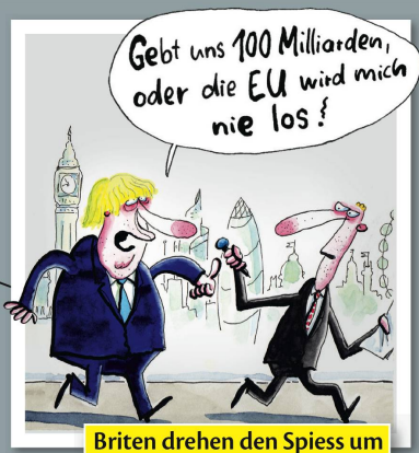
Briten drehen den Spieß um