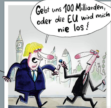
Briten drehen den Spieß um