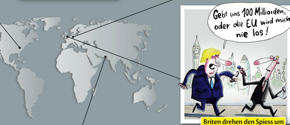
Briten drehen den Spieß um