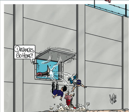
Mauer mit Babyklappe