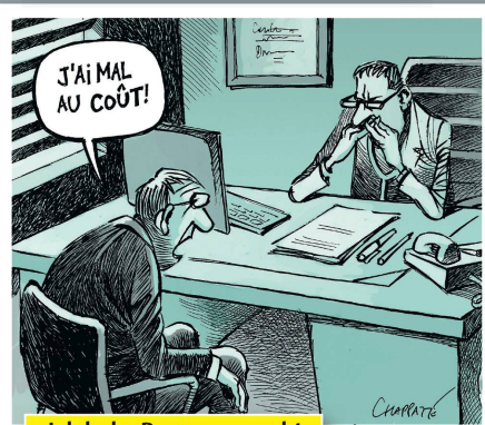
«Ich habe Portemo...weh!»