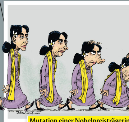
Mutation einer Nobelpreisträgerin