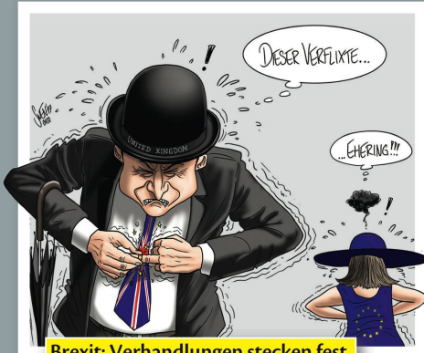
Brexit: Verhandlungen stecken fest