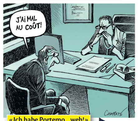
«Ich habe Portemo...weh!»