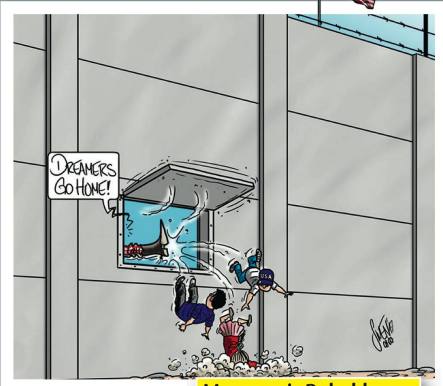
Mauer mit Babyklappe