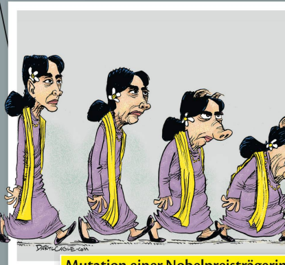
Mutation einer Nobelpreisträgerin