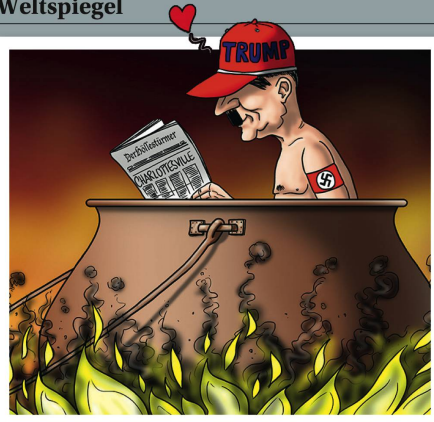
SWEN (SILVAN WEGMANN)