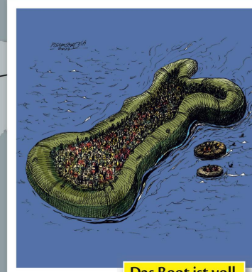
Das Boot ist voll.