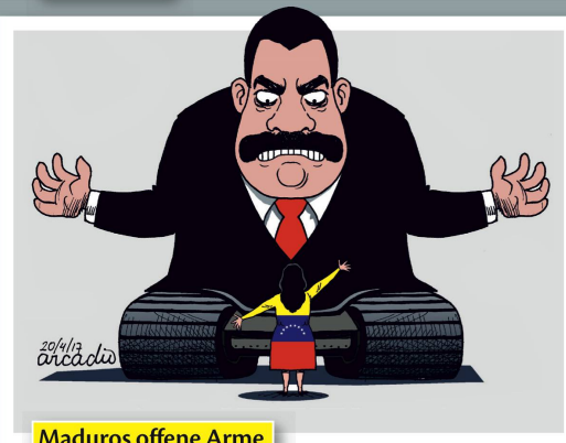
Maduros offene Arme