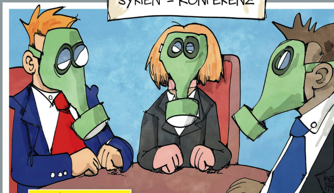
Die Chemie stimmt.