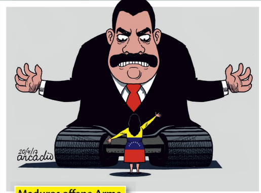
Maduros offene Arme