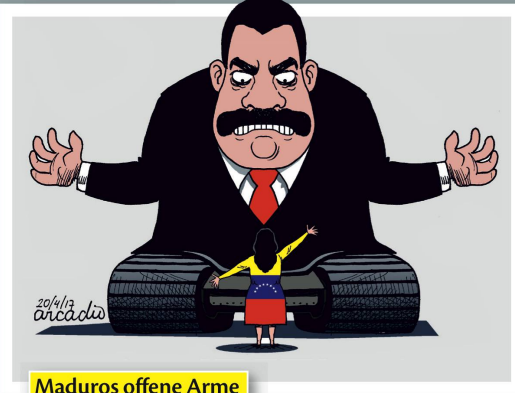
Maduros offene Arme