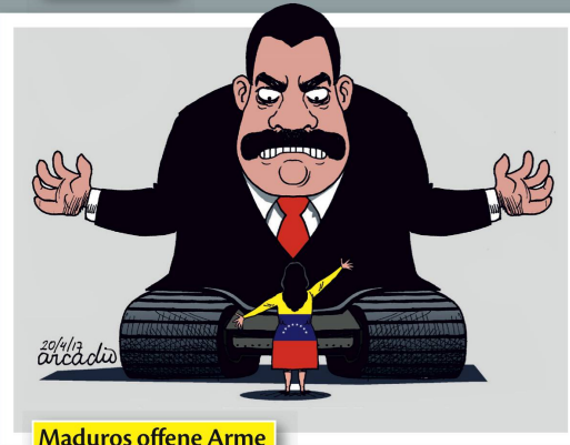
Maduros offene Arme