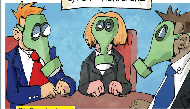
Die Chemie stimmt.