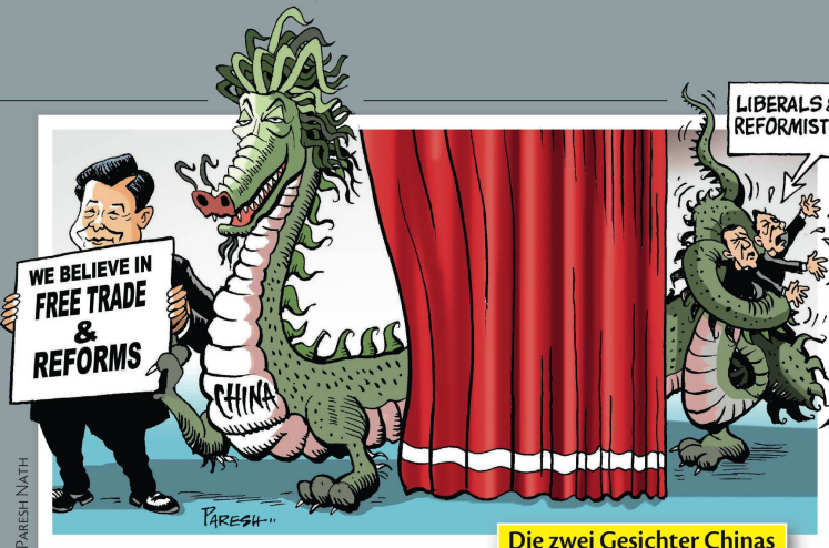
Die zwei Gesichter Chinas