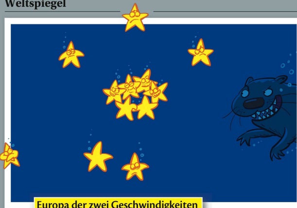
Europa der zwei Geschwindigkeiten