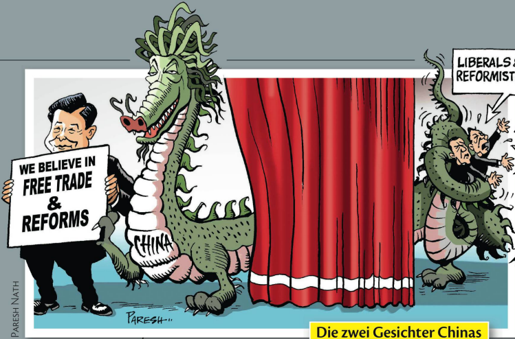
Die zwei Gesichter Chinas