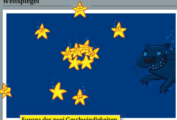
Europa der zwei Geschwindigkeiten