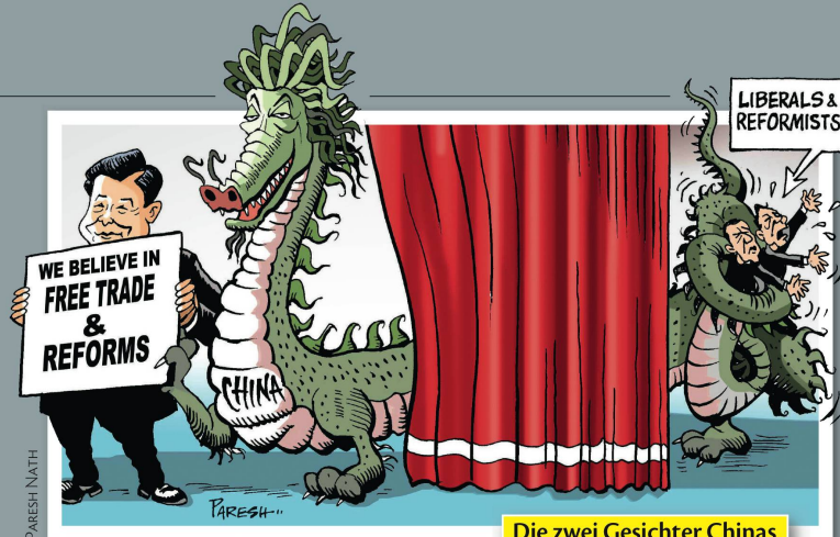
Die zwei Gesichter Chinas