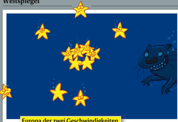
Europa der zwei Geschwindigkeiten