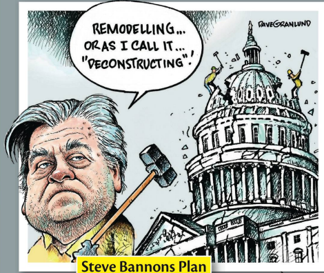
Steve Bannons Plan