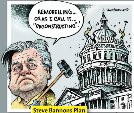
Steve Bannons Plan