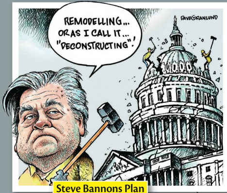
Steve Bannons Plan