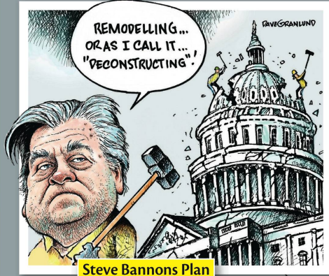
Steve Bannons Plan