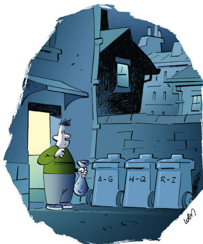
SCHNELL MUSSTE KURTI ERKENNEN, DASS DIE NEUE WOHNUMG AUCH IHRE NACHTEILE HATTE.